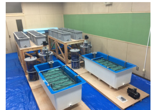
ファンド事業で開発した「閉鎖循環式アワビ養殖システム」 ENEX株式会社（美郷町）