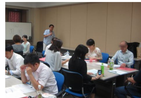
秋田絶品マーケティング塾