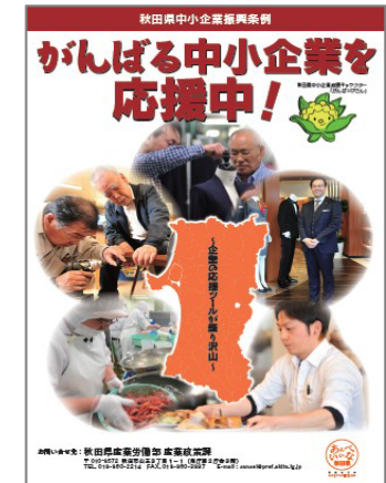
パンフレット改訂版