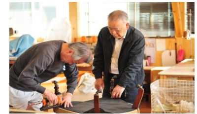
技術指導中の代表者