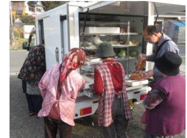
移動販売車による巡回