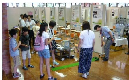
中小企業応援フェスタ(秋田市)