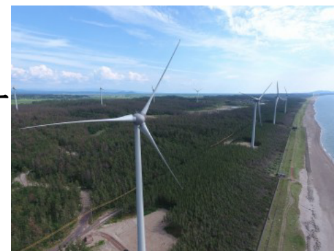
風の松原風力発電所(能代市)

【風力発電等メンテナンス技術者養成補助金：採択1社 (H27：2社、H26：2社)】