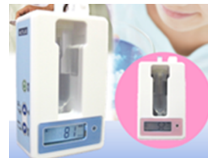
産業技術センターの技術支援により開発した高精度点滴センサー （(株)アクトラス（横手市））