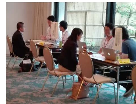
Aターン就職フェア(東京)