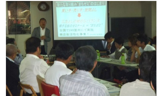
店主向けセミナー