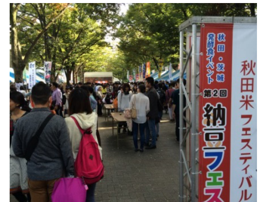
納豆フェスタ(東京)