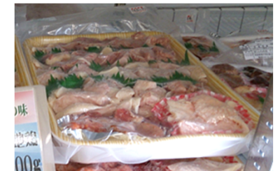
変更前のパッケージ