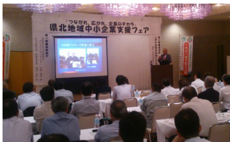
県北地域中小企業支援フェア(鹿角市)