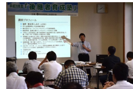
後継者育成塾(北秋田市)

【後継者育成塾受講者数(3地区開催)：秋田市21人、北秋田市20人 横手市15人(計56人)(計画数：60人)】