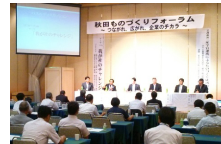
秋田ものづくりフォーラム(横手市)