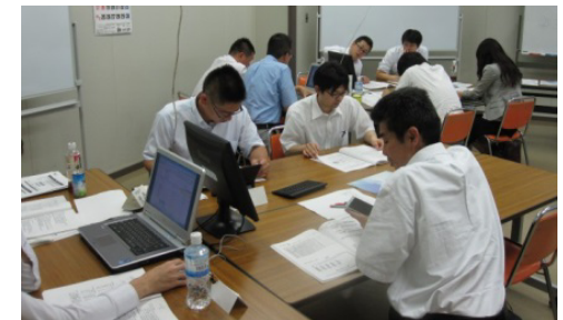
プロジェクトマネージャ養成講座