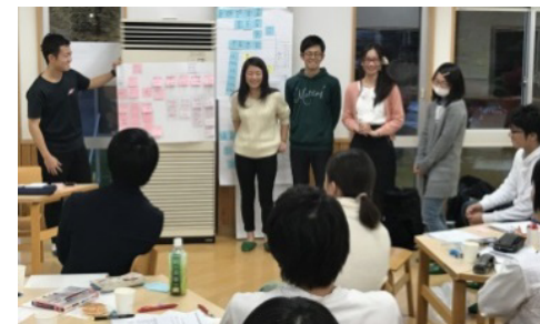
大学生等の起業家人材育成プログラム「おこめつ部」

【初期投資等の支援(起業支援補助金)新規採択 ：通常枠7件 Aターン・移住枠6件】