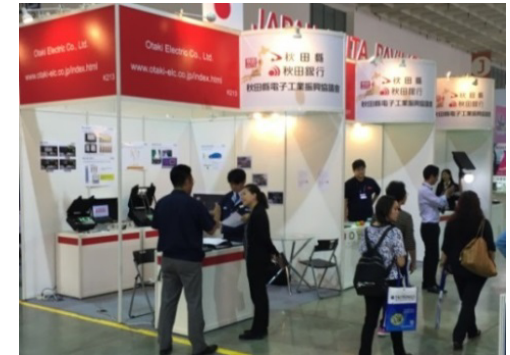
電子関係の大規模見本市 「タイトロニクス2016」(台湾) の秋田県ブース(6社出展)