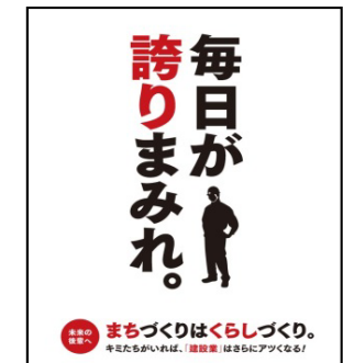
仙北建設業協会のチラシ